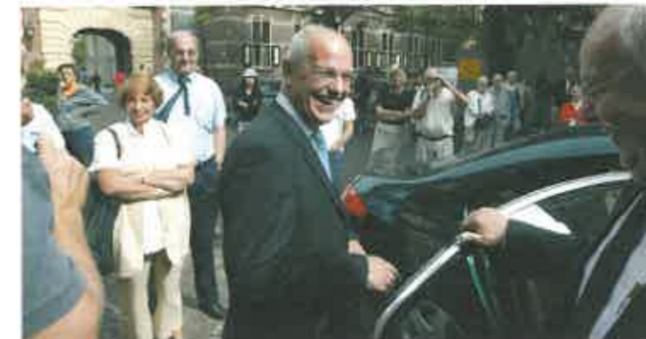
bron 3 Er is een verschil in status.

Het is niet makkelijk van een lagere naar een hogere sociale groep op te klimmen. Er is daarom weinig sociale mobiliteit .