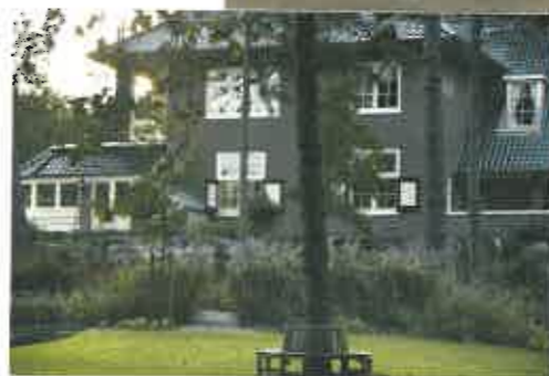
bron 2 Verschillende huizen, verschillende mensen.